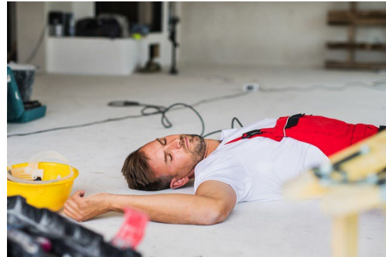
En elolycka kan få stora konsekvenser

Den som innehar en elanläggning har ett ansvar för de arbeten som utförs i elanläggningen. Här gäller det också att reda ut vilken eller vilka personer i organisationen som ska ha arbetsuppgiften att sköta detta.